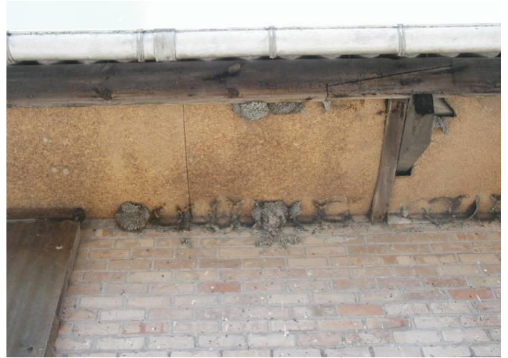
Vele nesten van deze kolonie te Beauvoorde vielen naar beneden en werden niet terug opgebouwd.