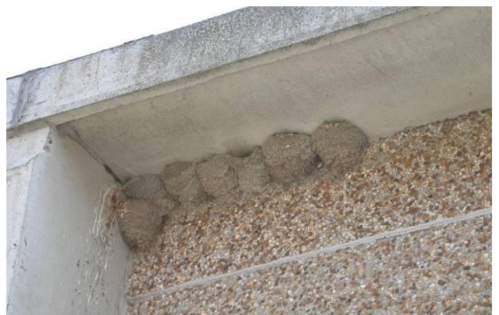
Natuurlijke nesten aan een landbouwloods in De Moeren (Debandt - 39 nesten)