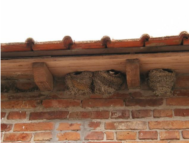
Drie nesten uit de kolonie van 37 nesten bij de familie Rau uit Pervijze