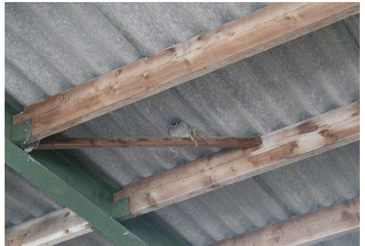
Nest huiszwaluw onder een golfplaat maar momenteel in gebruik door een huismus (Beauvoorde)