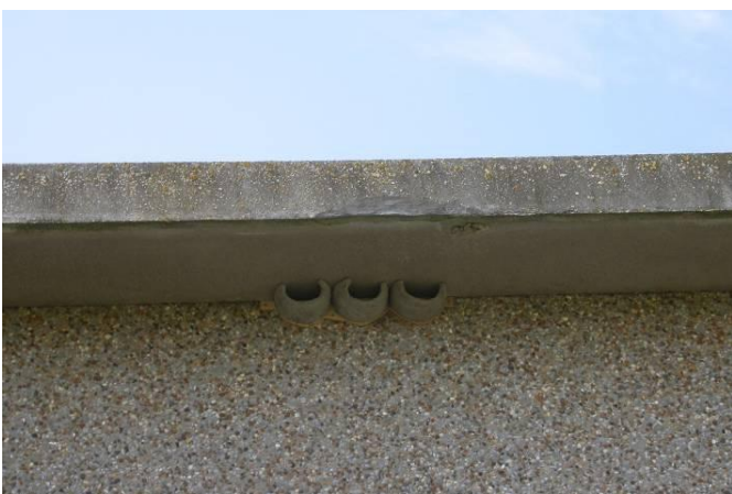
Drie nieuwe kunstnesten aan een landbouwloods te Houtem