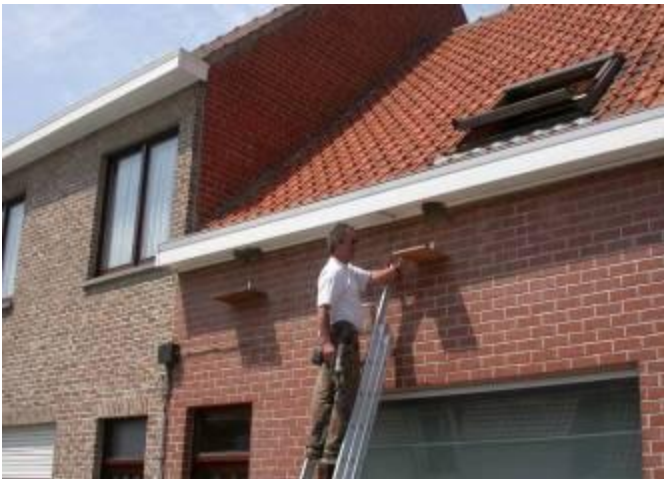
Marnix Decrock plaatst mestplankjes onder nesten te Houtem