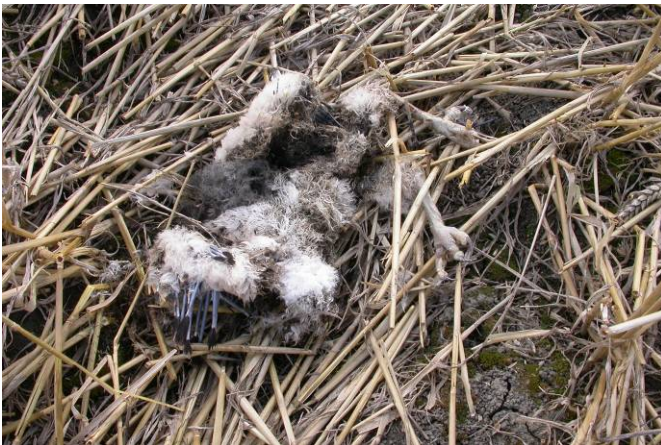
Één pulli overleefde de dorser niet