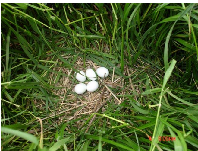
Nest met vijf pulli in de Buitenmoeren