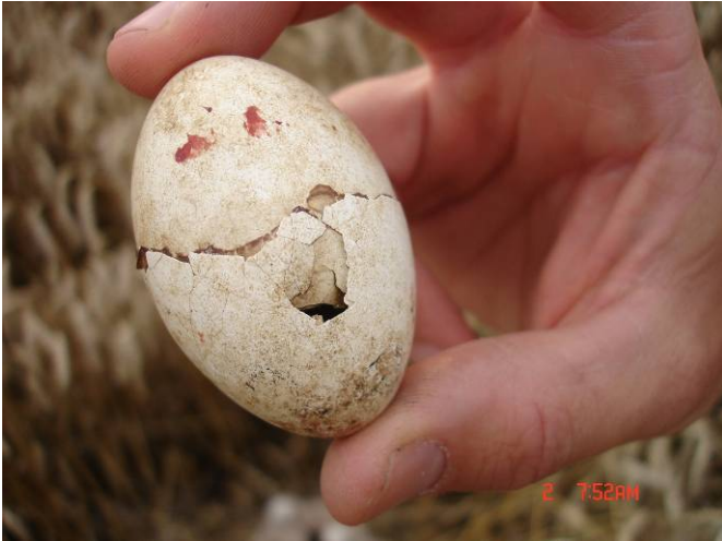
Net niet uitgekomen ei