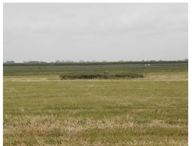
Vierkant na het maaien : broos