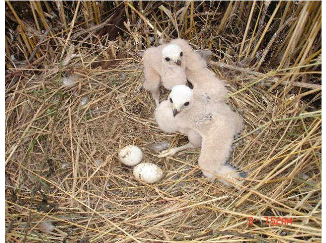
2 late pulli te Adinkerke