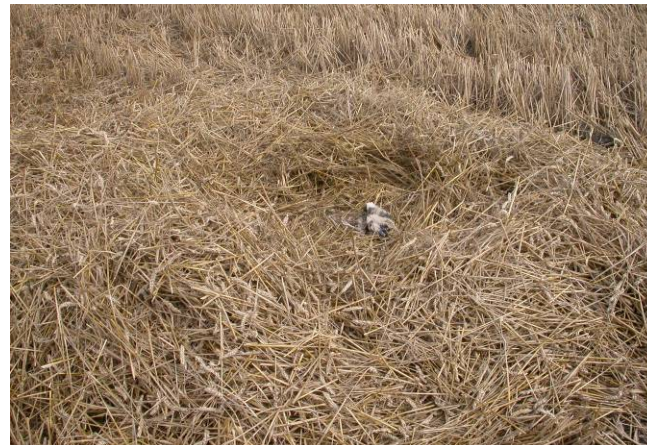
Het tweede pulli kreeg uitstel van executie